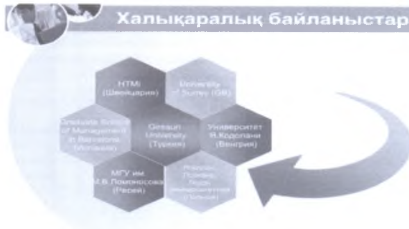
Сурет 2. Рекреациялық география және туризм кафедрасының халықаралық байланыстары

2. Орташа деңгей (басқарушылық-технологиялық). Басқарушылық-технологиялық деңгей технологиялық тұрғыда құрылымдардың өзара байланысын, қызмет көрсетудің технологиялық реттілігін қамтамасыз етуші қызметкерлер қалыптасады (турагент, орындарды брондау бойынша менеджер, мейрамхана метрдетелі). Бұл деңгейдегі мамандар жоғары және орта арнайы білім беретен оқу орындары, колледждер және т.б. білім орындарында дайындалады. Негізі олардың көбін бакалавр деңгейін бітірушілер құрайды.