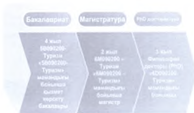
Сурет 1. Оқыту жүйесі

әл-Фараби атындағы Қазақ университетінде 1996 жылы 1 желтоқсанында, География және табиғатты пайдалану факультетінде, рекреациялық география және туризм кафедрасының негізі қаланды. Негізгі мақсаты - туризм және қонақжайлық саласында, мемлекет саясатын орындау мақсатына сәйкес, туризм индустриясына қажетті кәсіптік мамандарды даярлау жүйесін қалыптастыру. Кафедрада үш деңгейлі оқыту жүйесі қалыптасқан.