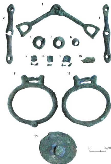
Рис. 1. Бронзовые детали снаряжения верхового коня из кург. 31 могильника Герасимовка.

1 – удила; 2, 3 – псалии; 4, 5 – ворворки суголовных и холочных ремней; 6 – ворворка подбородочного ремня; 7–9 – уздечные распределители ремней; 10 – фрагмент наносной подвески (?); 11 – подпружные пряжка и блок; 12 – подпружная бляха-застежка.