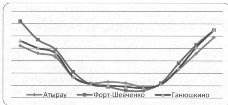
Рис.2 Годовой ход нижней облачности на станциях Атырау, Форт-Шевченко и Ганюшкино

Амплитуда годового хода повторяемости пасмурного состояния неба наиболее значительна в полупустынях и пустынях. В горах юга и юго-востока она несколько меньше, чем на прилегающих равнинах, и еще меньше в северных районах. На западе и юге республики он смещается на декабрь – январь (рис.2).