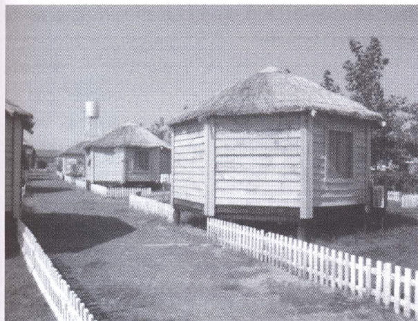
а) камышевые гостевые дома на с. Акши