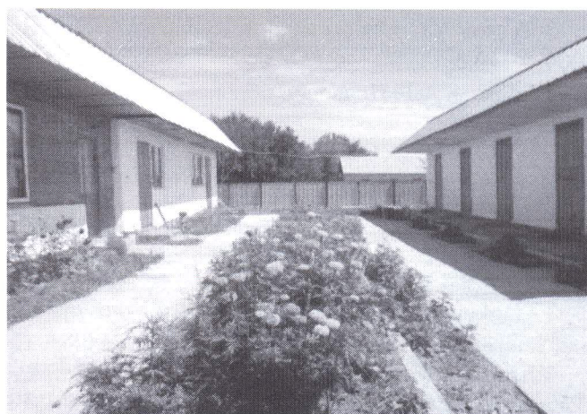
д) внутренний фасад гостевых домов