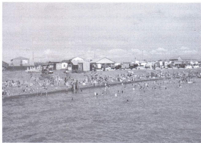
г) состояние побережья озера