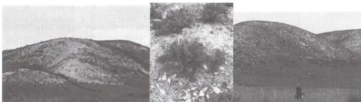
Сурет 1. Ақшатау борлы беткейлері (Ақтөбе облысы)