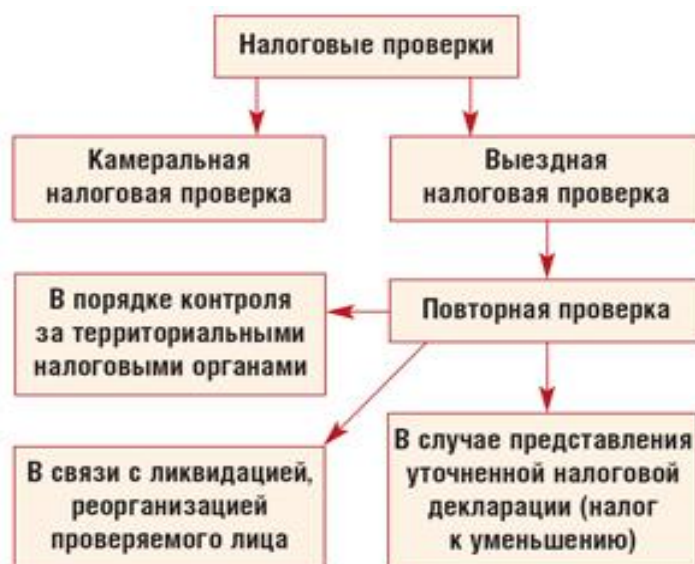
Рисунок 1. Налоговые проверки

Примечание. Составлено автором по данным источника