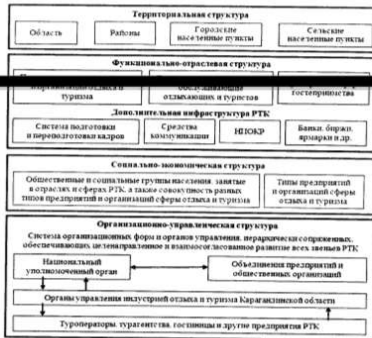
Рис.1 Структура рекреационно-туристского комплекса

Топографическая карта Центрального Казахстана масштаба 1:1 000 000 была разбита сеткой из равных квадратов 10 x 10 км. Для каждого из них определен показатель СЭП для развития РТК. Экстраполяция пространственной информации выполнена в Golden Software Surfer V. 11.2.848, основное назначение которого – обработка и визуализация двумерных наборов данных, описываемых функцией: z = f(x, y) .