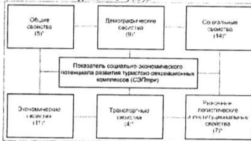
Рис.2 Группы критериев оценки СЭПtrk

Топографическая карта Центрального Казахстана масштаба 1:1 000 000 была разбита сеткой из равных квадратов 10 x 10 км. Для каждого из них определен показатель СЭП для развития РТК. Экстраполяция пространственной информации выполнена в Golden Software Surfer V. 11.2.848, основное назначение которого – обработка и визуализация двумерных наборов данных, описываемых функцией: z = f(x, y) .