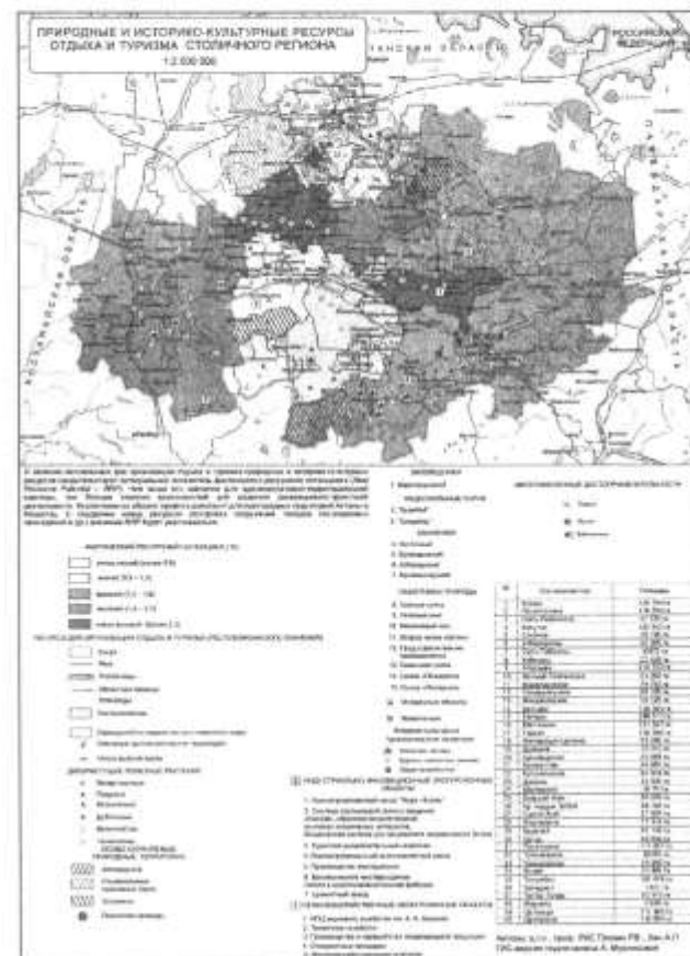
Рисунок 1. Природные и историко-культурные ресурсы для организации отдыха и туризма в столичном регионе Казахстана