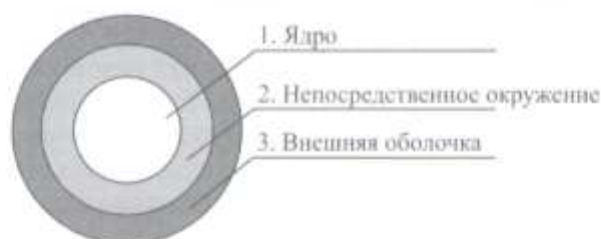
Рисунок 1 – Модель туристского потенциала региона

Для комплексной оценки ТПР предлагается использовать методику, концептуальную основу которой формирует представление о том, что уровень ТПР обусловлен влиянием трех групп факторов, разграниченных с помощью модели ТПР (рисунок 1).