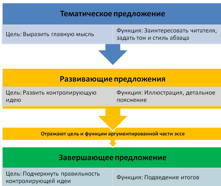
Рис. 2. Структура абзаца

Коммуникативной целью завершающего предложения является подчеркнуть правильность контролирующей идеи, выраженной в тематическом предложении и развитой в основной части абзаца. Функцией завершающего предложения является подведение итогов, суммирование изложенного в абзаце, а также обеспечение логического перехода к другой идее в случае, если за данным абзацем следует другой (6). Наглядно эту структуру можно представить в виде следующей схемы: