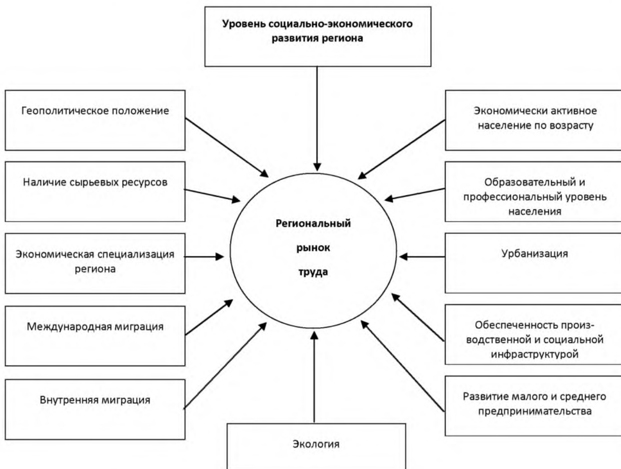
Рисунок 1 – Факторы формирования и функционирования регионального рынка труда

Ситуация на рынке труда и тенденции развития характеризуются изменением основных индикаторов: показателей экономической активности населения, занятости и безработицы. Экономически активное население региона, или рабочая сила, является составной частью трудового потенциала и человеческих ресурсов определенной территории. Численность и возрастная структура экономически активного населения в первую очередь обуславливаются происходящими демографическими процессами. Экономически активное население формирует предложение рабочей силы на рынках труда [2].