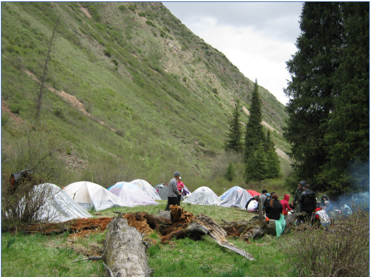
Рис. 3. Бивак.

Последний этап практики – это сдача полученного снаряжения, выполнение отчета и его защита. Отчет должен содержать сведения о целях и задачах практики, составе групп и руководителях, физико-географических особенностях района УТП, графике движения, особенностях и событиях каждого дня похода. Отчет должен иллюстрироваться картографическим материалом и фотоотчетом в хронологической последовательности. На карте изображается нитка маршрута, естественные препятствия и особо важные пункты, места ночевки, расстояния между пунктами и время. Для получения спортивного разряда участники должны заполнить маршрутную книжку, написать и защитить спортивный отчет в соответствии с правилами, установленными Федерацией спортивного туризма и туристского многоборья.