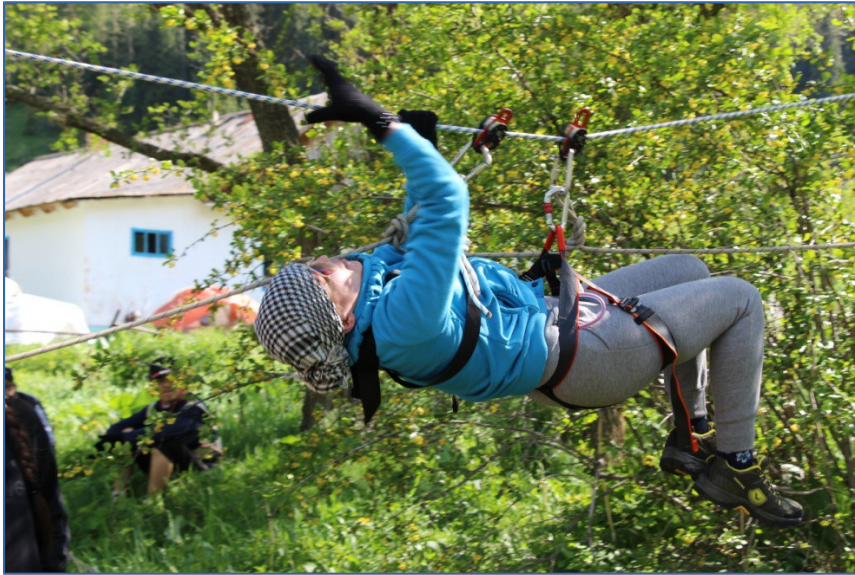
Рис 2. Занятия по технике туризма: переправа.

По итогам первого этапа производится отбор и уточняется окончательный список участников, вносятся коррективы в меню, список продуктов и снаряжения, составляется график дежурств (обычно одна или две палатки в зависимости от количества участников).