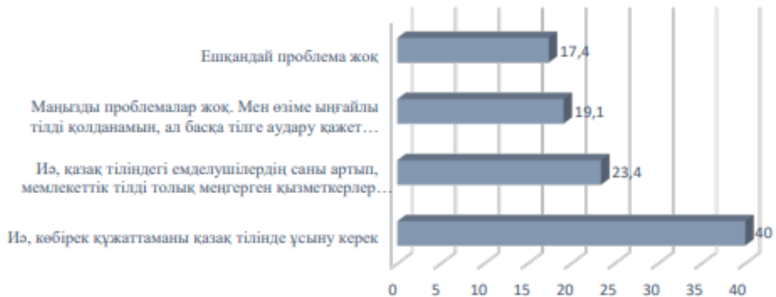
3 сурет – Денсаулық сақтау саласы мамандарының тілдік қиындықтары Дереккөзі: [3] әдебиет

Демек, медицина саласы мамандарының арасында мемлекеттік тілді қолдану айтарлықтай басым деуге болады, оған құжаттаманы мемлекеттік тілде толтыру қажеттігі негіз болып отыр. Бірақ, бұл денсаулық сақтау саласы мамандарының арасында тілдік мәселенің жоқ екендігінің дәлелі емес, керісінше мамандардың тілдерді игеруге деген ынтасын оятуы мүмкін.