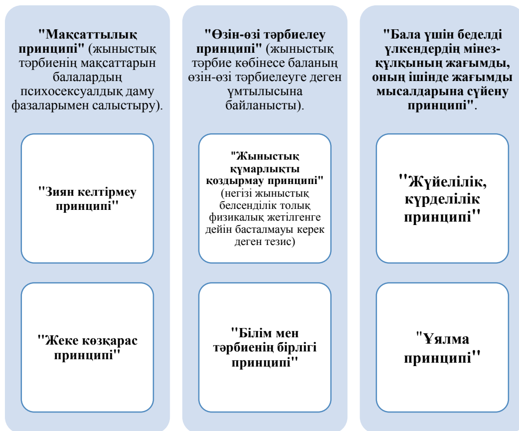
Сурет 1 – Тәрбиенің негізгі принциптері Ю.М. Орлова бойынша

Жыныстық тәрбиенің негізгі принциптері Ю.М. Орлова бойынша [2] (сурет 1).