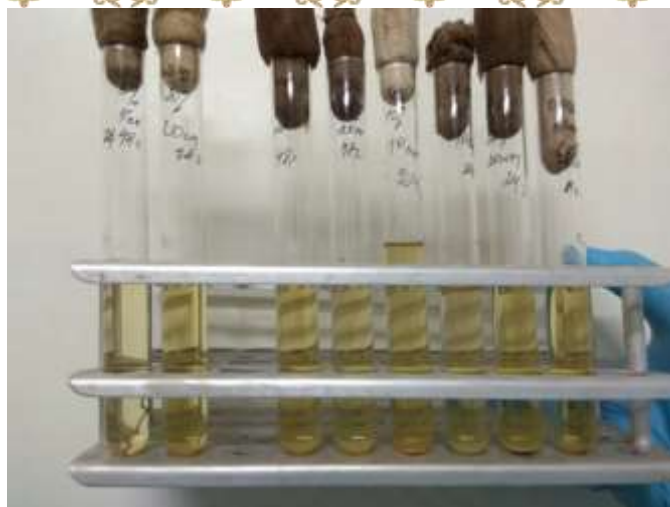
Рисунок 6 – Посевы экстрактов почвы на МПБ

Учет результатов проводили через 24-48-72 часа по наличию или отсутствию роста микроорганизмов.