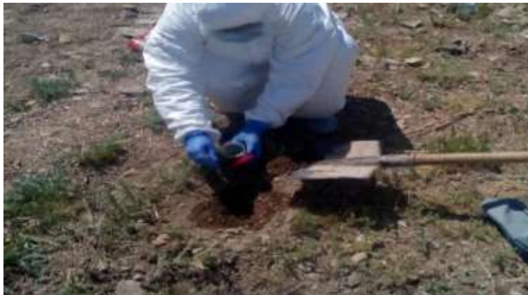
Рисунок 4 - Отбор проб почвы после ее обработки опытным дезосредством и упаковка их в пластиковый контейнер.

Экспозиция опытного дезосредства в лунках составляла: 60 минут, 120 минут, 180 минут, 5 часов, 24 часа и 48 часов, после чего с различной глубины отбирали образцы обработанной почвы, рисунок 4.