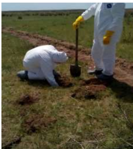
Рисунок 1 – Подготовка лунок для испытания дезосредства

На территории почвенного очага для эксперимента были подготовлены лунки размером 25 см x 25 см, из которых проводили забор проб почвы до и после внесения дезосредства из расчета 1,0 л/ м 2 , (рисунок 1).