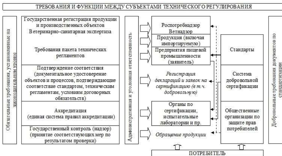
Рисунок 1 – Ранжирование требований и функций между субъектами технического регулирования[2]

Основными инструментами технического регулирования, являются технические регламенты, международные, национальные и региональные стандарты, процедуры оценки и подтверждение соответствия, аккредитация, контроль и надзор. Ранжирование требований и функций между субъектами технического регулирования представлено на рисунке 1. Вместе взятые инструменты технического регулирования обеспечивают безопасность и конкурентоспособность продукции[2].