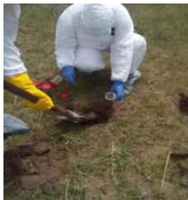
Рисунок 3 – Отбор проб почвы после ее обработки