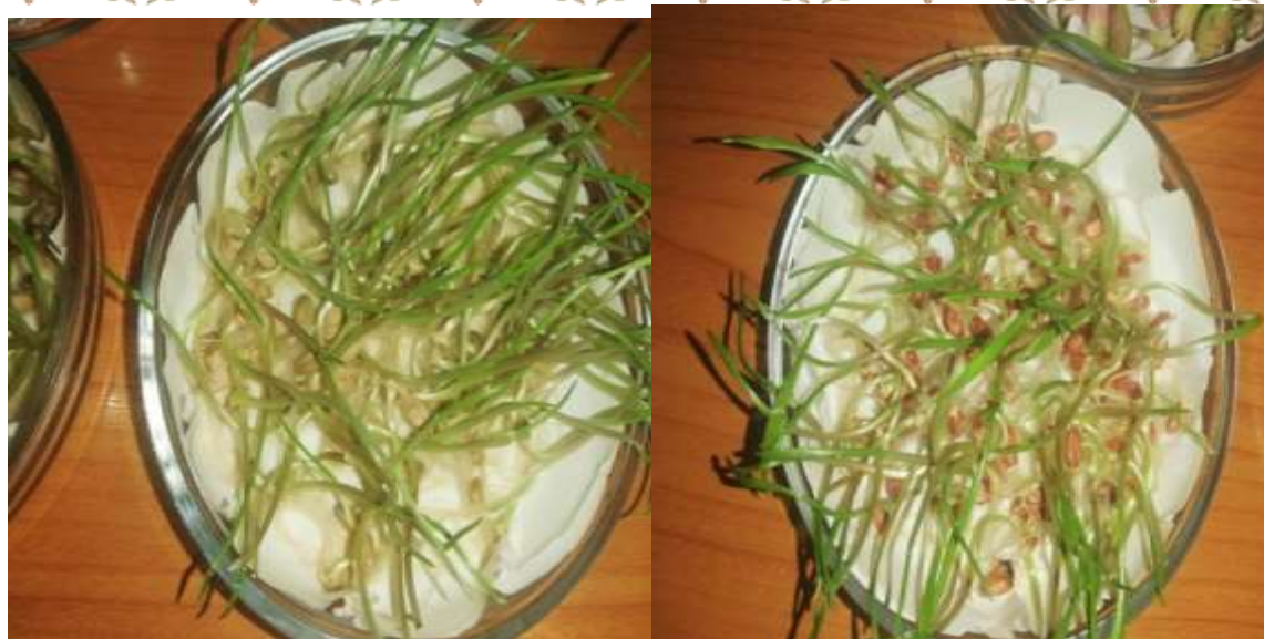
Сурет 1 – Жаздық бидай тұқымының өңгіштігі

Жаздық бидай тұқымдарын фитопатологиялық талдау арқылы жүргізілген фитосараптама барысында басым келетін саңырауқұлақ микрофлоралар анықталды.