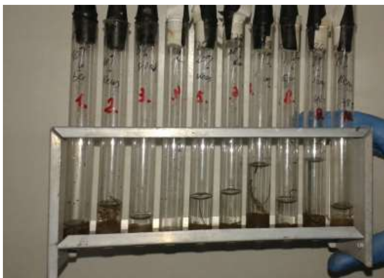
Рисунок 5 - Экстрагирование опытных и контрольных образцов почвы Далее полученные экстракты засеивали в пробирки с мясопептонным бульоном, рисунок 6.

В условиях лаборатории проводили экстракцию всех доставленных проб почвы на стерильном физиологическом растворе в течение 60 минут, рисунок 5.