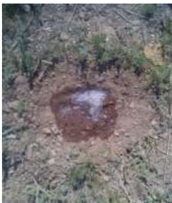
Рисунок 2 – Обработка лунки опытным дезосредством

В процессе опыта также определяли глубину проникновения раствора.