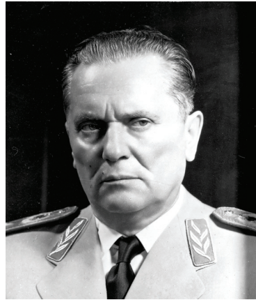
Josef Tito (Yugoslavya Devlet Başkanı)