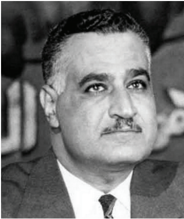
Cemal Abdülnasır (Mısır Devlet Başkanı)

Kıbrıs Rum Yönetimi diğer bir ismi BLOKSUZ ÜLKELER diye anılan Bağlantısızlar Ülkeler Zirve Konferansının Alt Komisyonuna daha önce de Seylan ve Küba aracılığı ile iki öneri sunmuştu. Kıbrıs Rum Yönetiminin Libya aracılığı ile Dışişleri Komisyonuna sunduğu önerinin görüşülmesi sırasında Afganistan, Birleşik Arap Cumhuriyeti ve Fas'ın önerinin reddedilmesi için büyük çaba harcadıklarını kaydetmek gerekiyor. Önerinin reddedilmesi için yeterli çoğunluk sağlandığı sırada Dışişleri Komisyonu'nun Hintli başkanı oturumu kapatacağını bildiriyordu. Başkan önerinin Dışişleri Komisyonu'nun ikinci toplantısında ele alınacağını bu sağlanamazsa önerinin devlet başkanları toplantısına sunulacağını belirtiyordu.