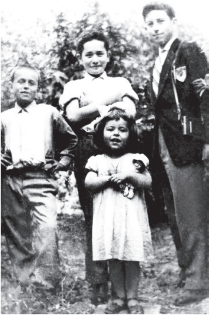
Minareli Köy'de evimizin bahçesinde kardeşlerimle, 1958.