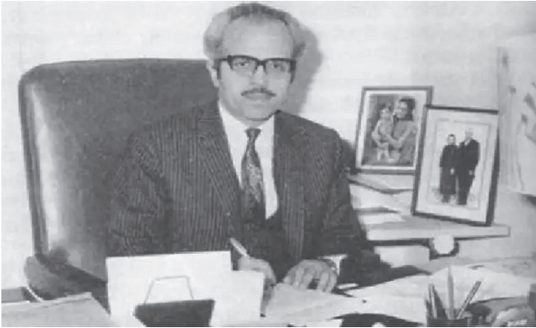
İçişleri Bakanı Polikarpus Yorgacis

Makarios'a karşı düzenlenen başarısız suikast teşebbüsünden sonra adanın her bölgesinde sıkı güvenlik önlemlerinin alınması son derece doğal bir yaklaşımdır. Lefkoşa'nın değişik bölgelerinde ev baskınları yapılarak araştırmalar yapıyordu. Yine akşam saatlerinde eski İçişleri Bakanı Polikarpus Yorgacis'in evine yapılan baskında iki dolu tabanca ile 6 adet otomatik silah şeridi bulundu.