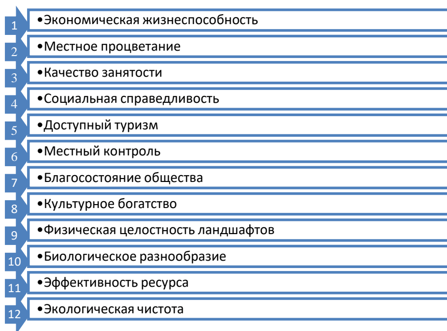
Рисунок 2. Цели устойчивого развития туризма

В рамках устойчивого развития туризма ЮНВТО выделила приоритетные цели устойчивого развития туризма (рис. 2) [5, С.1].