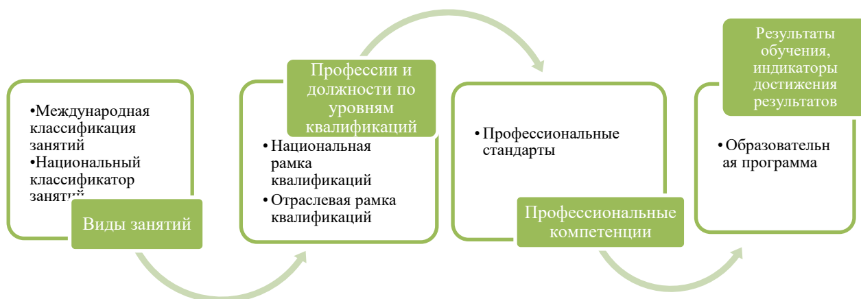
Рисунок 1 – Процесс разработки образовательной программы

Общую схему разработки образовательной программы по направлению подготовки можно представить в виде ряда логически взаимосвязанных действий (рисунок 1). Однако, следует помнить, что на начальном этапе выполняется сравнительный анализ с аналогичными программами ведущих профильных университетов мира, а в процессе реализации программы осуществляется мониторинг и обеспечивается обратная связь с рынком труда.