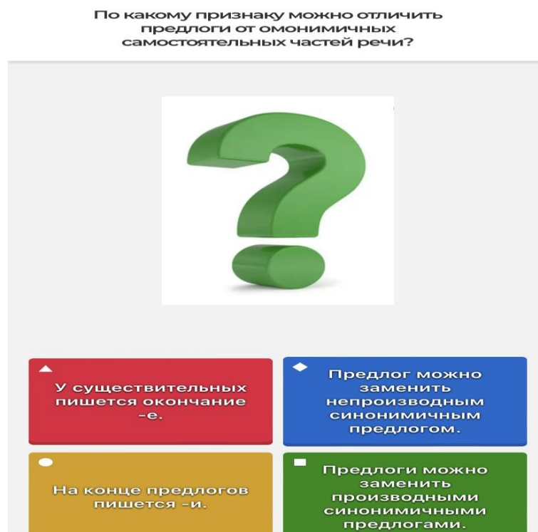
Рисунок 2. Пример вопросов в Kahoot

Большей результативности в процессе обучения предмету можно достичь путем различного подхода к оцениванию, сделав процесс более интерактивным.