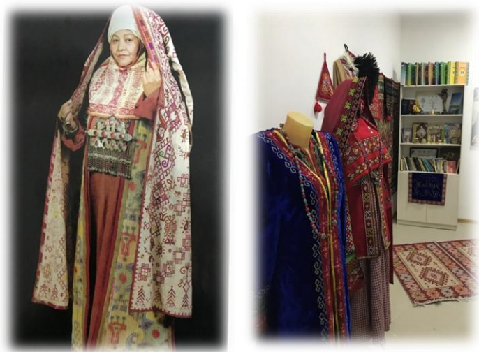
6-сурет. Қарақалпақтардың әйелдерінің киім үлгісі

ИБ №1410 Формат бумаги 60×84/ 1/16 Бумага офисная Печ. Л.19,5 Ус печ.л.18,13 Тираж 500 экз.