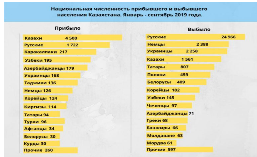
3-сурет. 2019 жылдың жарты жылында Қазақстанға келген қарақалпақтар саны.