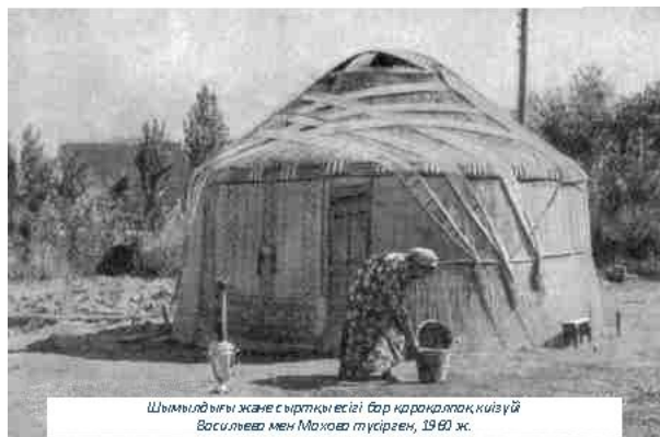
2-сурет. Киіз үй