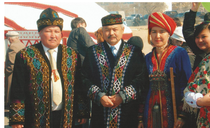
4-сурет. Қазақстандағы қарақалпақ этносының өкілдері.