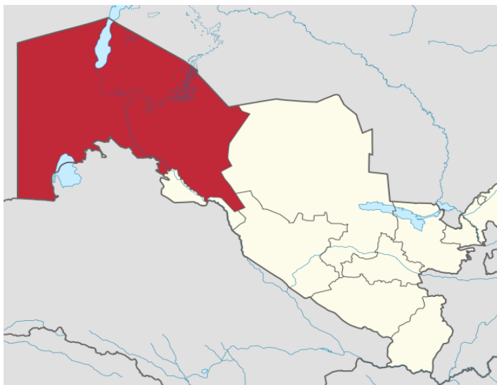
5-сурет. Қарақалпақ мемлекетінің картадағы көрінісі