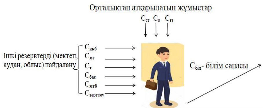
1-сурет – Орта білім беру сапасын көтеру мақсатында ішкі резервті пайдалану

Төмендегі суретте эксперимент идеясы көрсетілген.