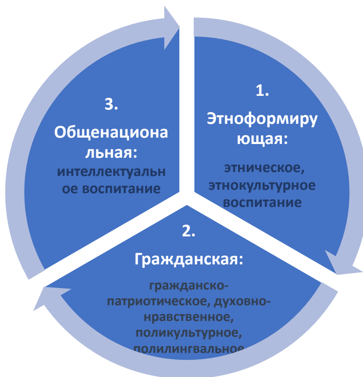
Рис. 2. Содержание структурных компонентов новой Модели национального воспитания учащейся молодежи Казахстана

В основу данной модели легли ряд концептуальных положений обозначенных: