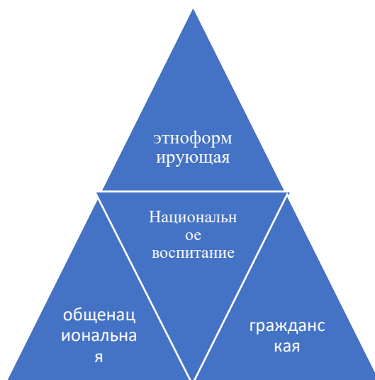
Рис. 1. Модель национального воспитания

Особенностью данной Модели является то, что формирование национального самосознания будущих специалистов Казахстана, как главной цели национального воспитания, рассматривается в ракурсе трех ее плоскостей: 1) этноформирующей , направленной на сохранение культурного кода нации; 2) гражданской , направленной на расширение диалога с различными культурами человечества; предотвращения самоизоляции, самоотчуждения и самоограничения; 3) общенациональной , направленной на развитие интеллектуального потенциала и конкурентоспособности будущих специалистов (см. Рис. 1)