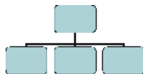
Рисунок 1 – Социальные взаимоотношения