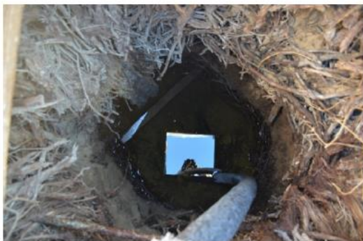
Сурет 1. Үрген қонысының маңындағы шегенделген құдық