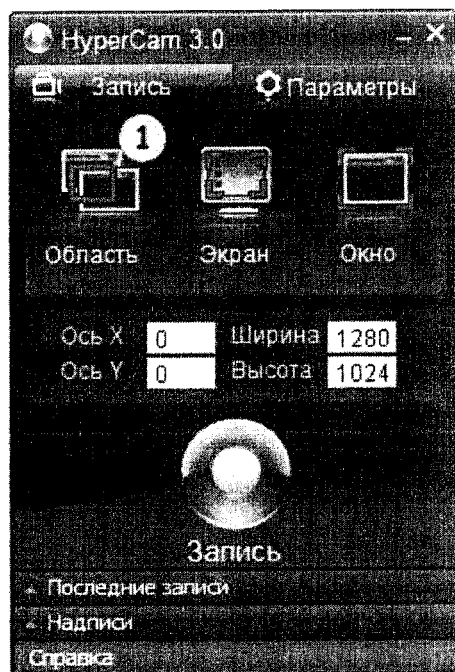
1-сурет. HyperCam3 бас терезесі.

Видео жазуға келетін болсақ, бірінші қадамымыз 1-суреттегідей HyperCam3-ті қосамыз.