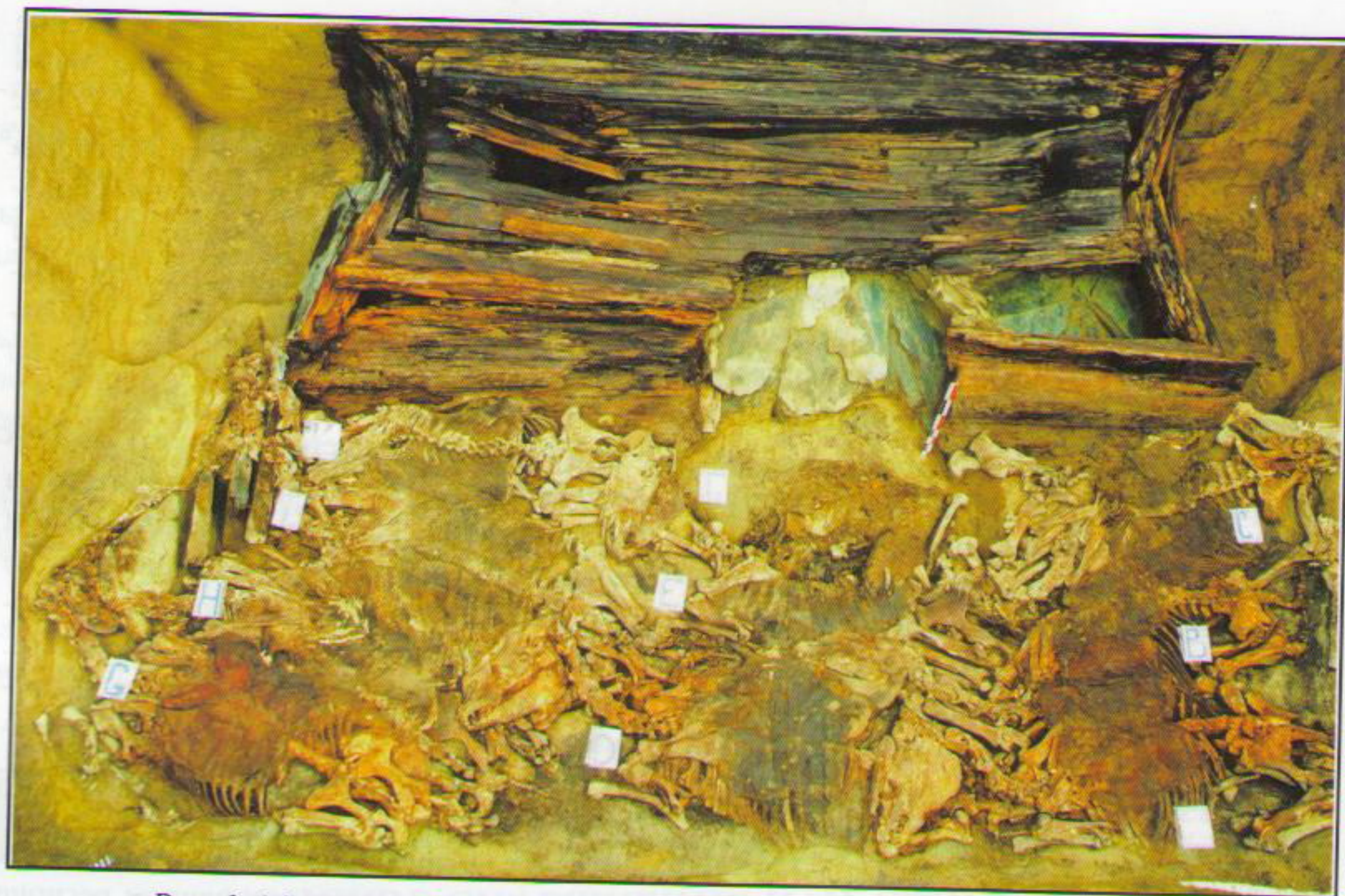
Рис. 1. Могильник Берел. Курган № 10. Внутримогильная конструкция погребального сооружения (по З. Самашеву)

Учитывая необходимость регулирования кочевого образа жизни при совместном землепользовании в рамках всего Горного Алтая в целом, говорить о существовании централизованной государственности и центрах военной мощи еще рано. К сожалению, поиски и раскопки поселенческих комплексов в регионе еще не проводились.