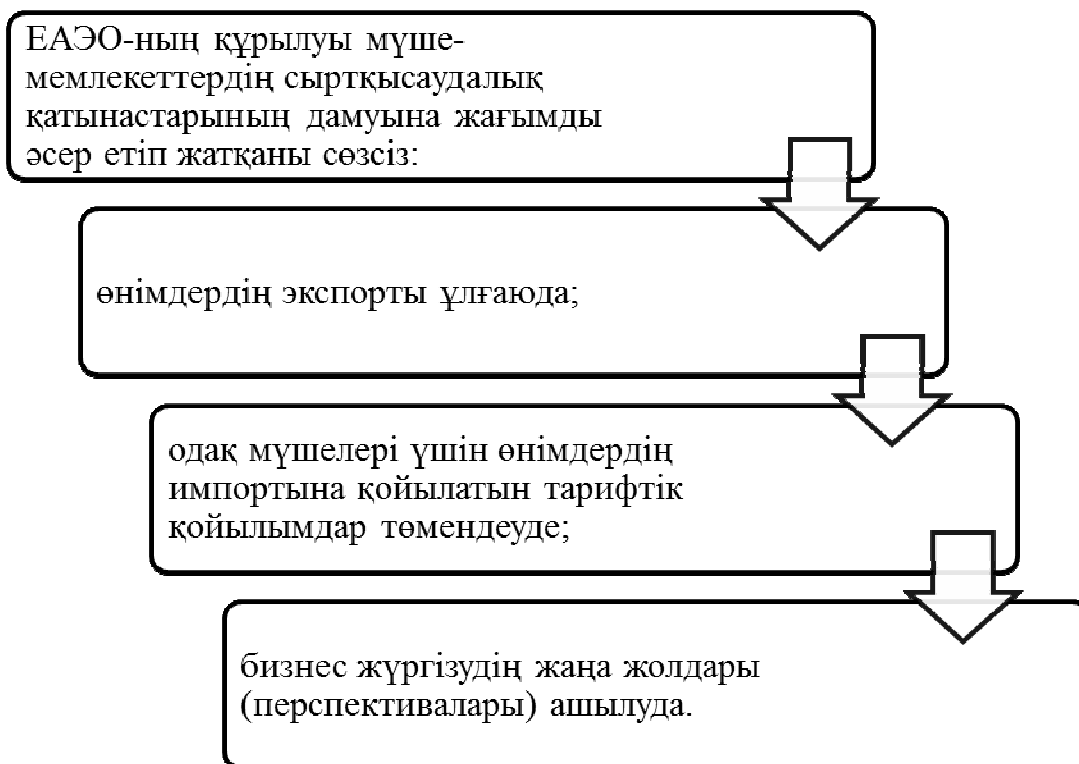
Сурет 2 - ЕАЭО-ның құрылуы мүше-мемлекеттердің сыртқысаудалық қатынастарының дамуына жағымды әсерлер

Ескерту: [8] әдебиет көзінің негізінде автор құрастырған.