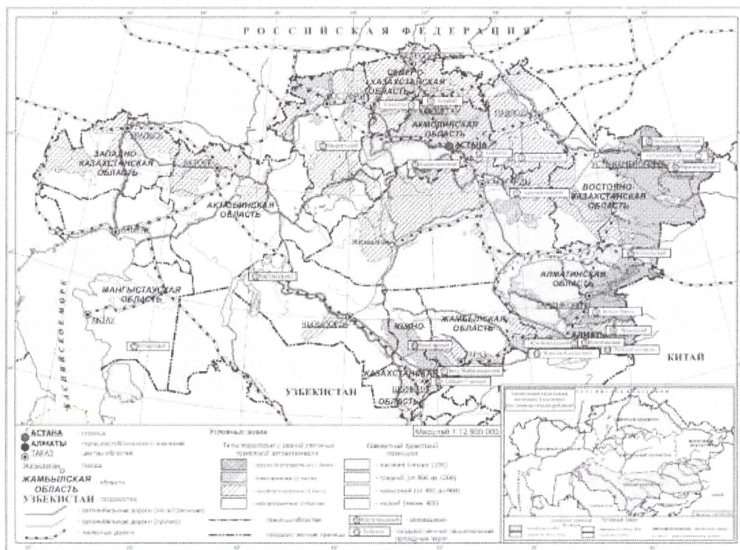
Рис. 1. Совокупный туристский потенциал Казахстана [3]

Если рассматривать статистику туризма по курортным зонам и специализированным местам размещения Карагандинской области, то она выглядит следующим образом. В 2014 году Каркаралинскую и Балхашскую курортные зоны посетило 61579 человек. При этом общий номерной фонд составляет 1317 единиц, а единовременная вместимость 3657 койко-мест. Специализированными местами размещения в 2014 году обслужено 16131 человек, располагая при этом 1705 койко-местами единовременно. Отсюда, в 2014 году курортными зонами и специализированными местами размещения Карагандинской области обслужено 77710 человек [2]. По предварительным подсчётам максимальное количество человек, которое может быть обслужено местами размещения курортных зон и специализированными местами размещения Карагандинской области, составляет 240893 человека в год.