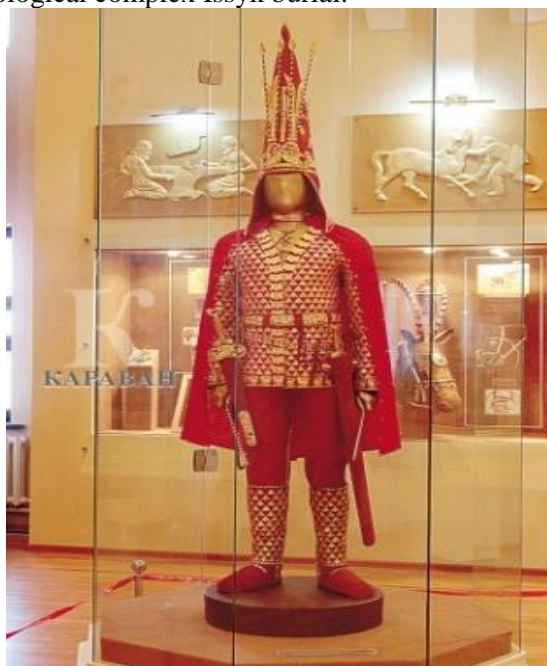
Fig. 1. "Golden man" reconstruction which was found in "Esyk"

In 1969, a group of Kazakh scientists under the leadership of Kemal Akishevich Akisheva was discovered a unique archaeological complex Issyk burial.