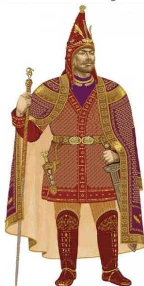
Fig. 4. East-Kazakhstan region, Zaisan district, Baygetobe place "Golden Man" found in the mound №1 of Shilikty 3 www. tengrinews.kz

archaeological excavations have added another story in the Kazakh steppe. This monument is found the archeologist Arman Beisenov. during excavations of burials found in the zone around a hundred, twenty-eight images of a lion in gold bullion, in the form of jewelry, adapted to the shape of the dragon, gold-plated wild boar. Relief paintings are also in our coat of arms in the image of horses, they found more than a thousand precious beads. It is seen here buried most powerful man. According to archaeologists Arman Beisenov, many things were stolen. This golden man is very important information for the history of scientific data. this wealth is not found every day, said archaeologist [5. 121-128-p]. This trophy of the people in the country's history as a whole is a scientific value, The Golden Man, he's a soldier on guard. Soldier's body in the chest completely covered in gold, such respect for those who is the ruler of the sun. Historians call this place the Valley of the Kings. our ancestors have great respect for the sun and the thought that God is there. The ruler of the sun in the face of the valley of the kings became the nation beam. the sun is not quenched. Even if the golden man is slightly different, but similar to those found in other regions of the country [6.43-58-p].