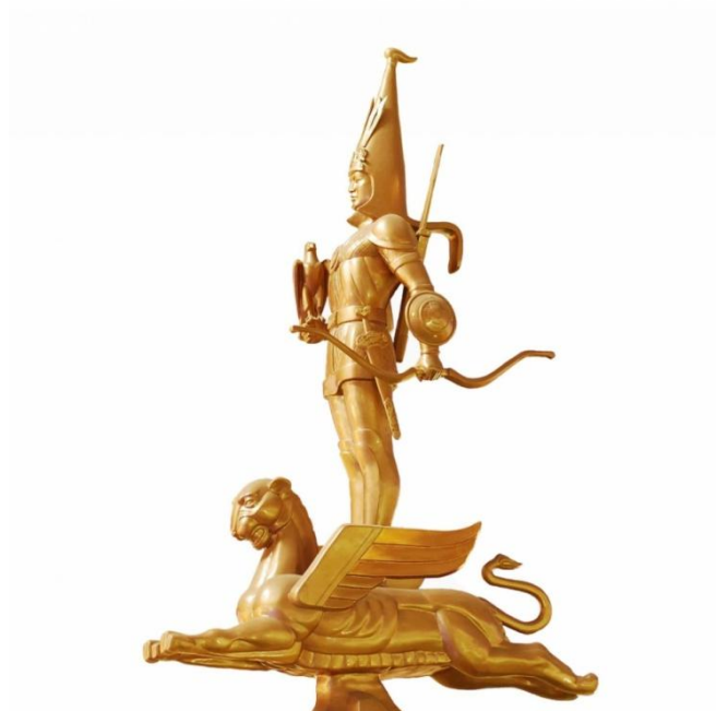
Fig. 2. Independence Monument in Almaty www.armedia.am

Architects create new reconstruction of "Golden Man" in female form (in particular, we are talking about a headdress). Make them opening published in the journal "Kumbez" where they write that "finds itself cast doubt on the assertion that it was a young man," referring to Point handbag with cosmetic bag and a mirror next to burial. With regard to the allegedly discovered male subjects - a sword and a dagger: "There are very many Saka and Sarmatian female graves, obviously, being the objects of the rite, it applies to both men and women, or simply charms. In addition, funeral outfit consisted not only of gold items, but mainly from organic materials that have not been preserved. And he could be both male and female, and the variations on this theme can be infinite. " In the southern and western side of the grave can be seen. 26 ceramic vessels. The body length of 165 cm. A height of 70 cm. There are several options for reconstruction of the costume and headdress. Presumably, this is - Sak-tigrahauda because his head pointed headdress 70 cm high, decorated with gold plates and plaques depicting horses, leopards, mountain goats, birds, trees. Around his neck is a gold torque with tips in the form of a tiger head. On the left side of the skull was discovered a gold earring decorated with beading and turquoise pendants [3.76-p].