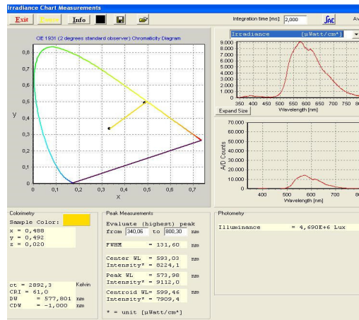
Рис. 3. Пример информации отображаемой на дисплее спектрометра

В таблице 1 приведены сводные характеристики спектров ИКЛ и фотолюминесценции для исследованных люминофоров.