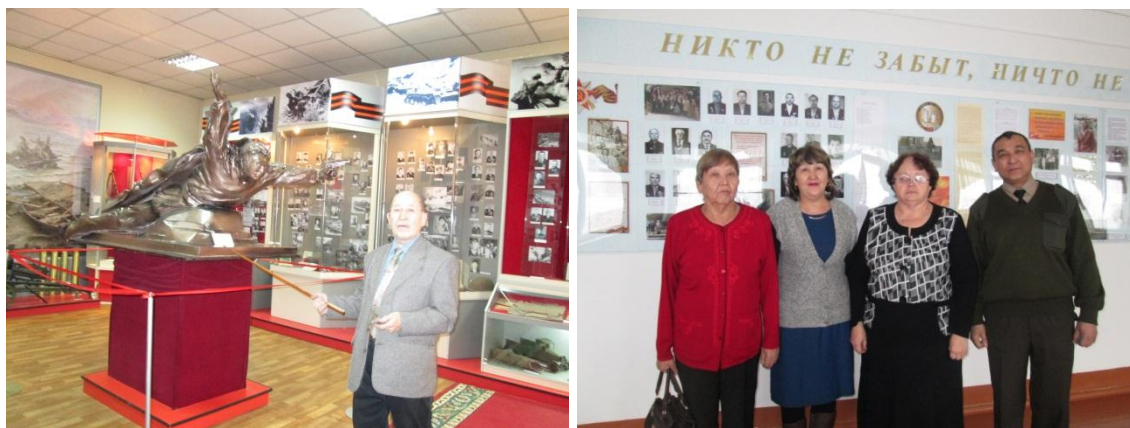
Музеи г. Семее и пос. Асу-Булак

Восточноказахстанцы не забывают о подвигах земляков, в областных и районных газетах выходит рубрика «70 лет Победы», в память о восточноказахстанцах участниках войны во всех городах и поселках области действуют музеи Славы.