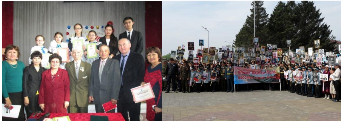
Республиканская конференция среди школьников в с. Калбатау школе-лицее им. Абая посвященная 70-летию Победы в Великой Отечественной войне Построение Бессмертного полка в г. Семее 9 мая 2014 г.

Во всех учебных заведениях кроме уроков истории учащимся рассказывают о войне и вкладе восточноказахстанцев на конференциях, факультативах, приглашая участников событий тех лет.