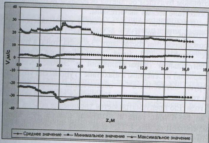
Рис.3. Распределение вектора полной скорости по высоте камеры сгорания

заполнения области камеры над горелками у передней и задней стен развиваются вихри. Часть восходящего потока направляется на выход из топки. Избыточный расход рециркулирует, образуя у стен в области над горелками вихревые области. Наличие вращения потоков в пристеночной зоне способствует равномерному обогреву поверхностей и снижению ошлакования экранов, что позволяет уменьшить коррозию и тепловой перегрев [2]. По мере удаления от плоскости расположения горелок поле скоростей выравнивается, восходящий поток расширяется, и вихревой характер течения ослабевает. К выходу из топочной камеры восходящий поток интенсивно расширяется и на выходе равномерно распределяется по всему сечению.