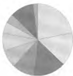
2-сурет – Білім және ғылым туралы жиі оқылатын сайттар

Статистикалық мәліметтер көрсеткендей, халықтың көпшілігі жеңіл әңгімелер мен, шоу-бизнес жаңалықтарын көп қарайтыны анықталды. Ғылыми-танымдық, зерттеулерге қазақ тілінде интернетте әлі де сұраныс болмай отыр. Тек тегін реферат, сабақ жоспарлары салынатын сайттар сұранысқа ие.