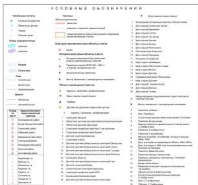
Рисунок – Карта объектов КИП для развития рекреационно-туристских комплексов в Центральном Казахстане (в границах Карагандинской области)

Оценка значимости и последующее картирование объектов КИП Центрального Казахстана нами осуществлены с использованием трех подходов: 1) факторного – оценка каждого объекта, ресурса, фактора, параметра в отдельности; 2) ценностного – расчет среднего, кумулятивного, совокупного показателя; 3) тематического – оценка каждого объекта, ресурса, фактора, параметра в привязке к конкретному виду туризма.