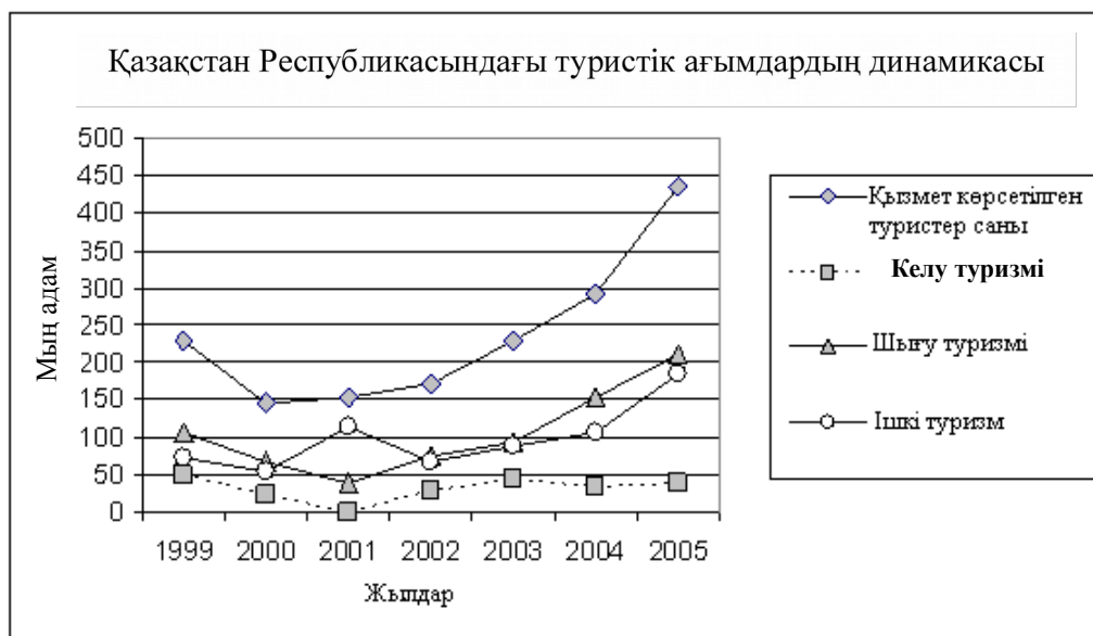
Статистикалық мәліметтер бойынша құрастырылған [132]

Қазақстанның табиғи туристік әлеуеті мен тарихи-мәдени нысандарын ескеріп, шетелдік туристерге қайталанбас табиғи ландшафтарын, эндемикалық флора мен фаунасын, тарихи-мәдени мұра ескерткіштерін қамтитын құрамалы турларды ұсынуға әбден болады. Халықаралық туристік нарыққа шығу үшін Қазақстан табиғатының өзгешеліктеріне негізделген турларды, мысалы, джип мініп, киіз үйлерде немесе арнайы жабдықталған трейлерлерде түнеп саяхат жасауға арналған «Кең даладан мәңгі қар жатқан тау шыңдарына шейін», «Далалық сафари» ұсынуға болады. Каспий теңізіндегі жағажайлық және круиздік демалысты дамыту мақсатында Кеңдірлі демалыс зонасын жабдықтау мен Ақтау қаласында туризм мен ойын-сауық индустриясын дамыту, Оңтүстік Қазақстанда, Қапшағай бөгенінің жағасында «Жаңа Іле» туристік орталығының құрылысы жоспарланған. Оған емдеу-сауықтыру, мәдени-ойын-сауық және туристік инфрақұрылымның басқа нысандары кіретін болады.