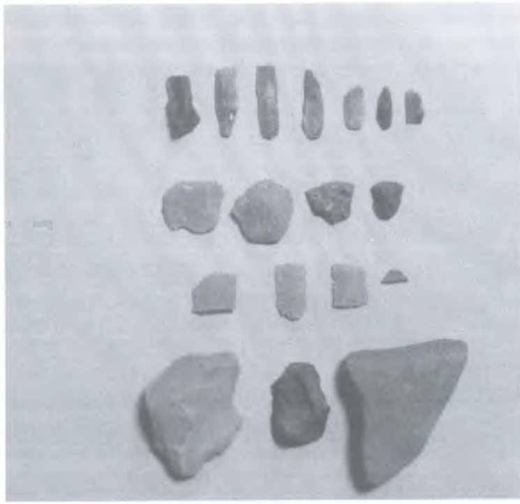
Сурет 3. Жетібай ескерткішінің тас құралдары.