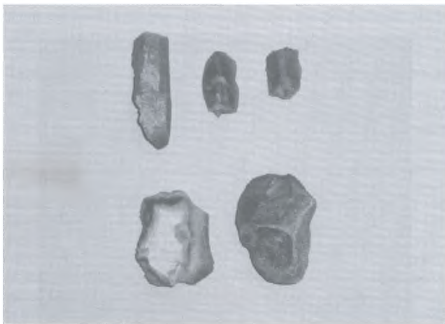
Сурет 2. Бисен ескерткішінің тас құралдары.