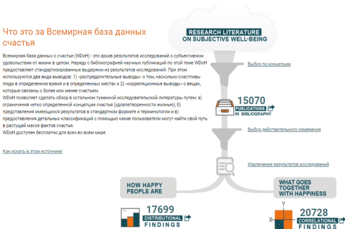
1 сурет. Дүниежүзілік бақыт туралы мәліметтер базасы

https://worlddatabaseofhappiness.eur.nl/