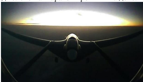
Рисунок 3 – Беспилотник Bayraktar TB2

Некоторые эксперты выражают пессимизм в эффективности БПЛА, объясняя это ограниченностью возможностей беспилотников. Хотя, их применение и оказывает определенный психологический эффект. Постоянное барражирование над головой аппаратов противника довольно болезненно.