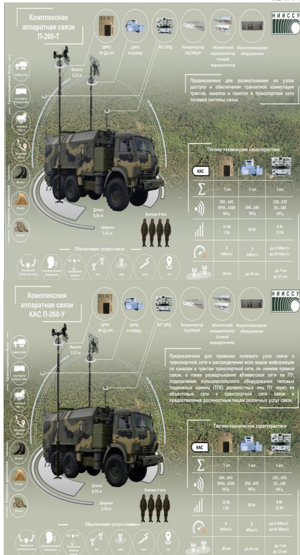
Рисунок 1- Комплексная аппаратная связи П-260Т, П-260У

На рисунке 2 показан вариант подключения элементов сети широкополосного радиодоступа в комплексной аппаратной связи.