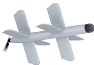
Рисунок 1 - Барражирующий боеприпас «Ланцет-1».

Тип взрывателя - предконтактный. Комплекс способен поражать цели в радиусе до 40 км. Максимальная взлетная масса - 5 кг [3, с.67].