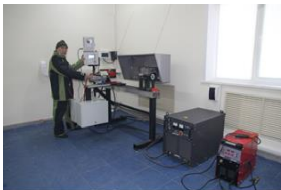
Рисунок 4. Сверхзвуковая электродуговая металлизация.

Совместно с Департаментом геоинформационного обеспечения МО РК на базе Технологического парка создается научно-образовательная лаборатория военно-космических технологий. Лаборатория перспективных геоинформационных технологий является разработка технологий производства новых видов геопространственной продукции и методики их внедрения в систему поддержки принятия решения органов военного управления. Инструментальное обеспечение научно-исследовательских и опытно-конструкторских работ в области формирования технологий информационно-космического вида боевого обеспечения.