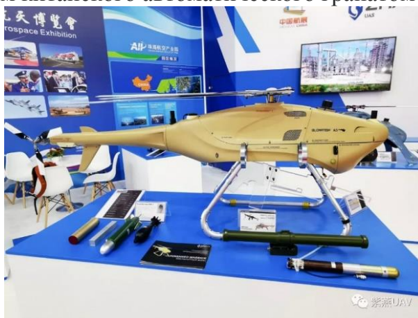
Рисунок 4 – БПЛА Blowfish A3 китайской компании ZIYAN

На международном авиационно-космическом салоне МАКС-2019 китайская компания ZIYAN – разработчик многофункциональных беспилотных летательных аппаратов вертолетного типа представила свою новинку – ударный БЛА Blowfish A3 (Рисунок 4). В состав вооружения беспилотника входит полуавтоматический гранатомет QLB-06, являющийся дальнейшим развитием китайского автоматического гранатомета QLZ-87.