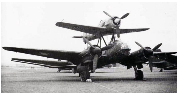
Рисунок 1 – Летаящая бомба «Мистель»

В начале 40-х годов , нацистская Германия создала авиационный комплекс военного назначения в конце Второй мировой войны. Самый известный, германский проект «MISTEL-3C» (Рисунок 1), где обычные два самолета Ju-88 и Fw-190 соединенных один (Fw-190) над другим (Ju-88) с помощью распорок, закрепленных на фюзеляже. Эти самолеты переделывались в начиненные взрывчаткой дроны, доставляемые к целям самолетами-носителями.