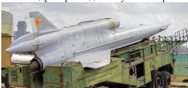
Рисунок 2 – Ту141 «Стриж»

В 70-х годах конструкторское бюро Туполева (СССР), разработало многоцелевой реактивный дрон-разведчик Ту141 «Стриж» (Рисунок 2).