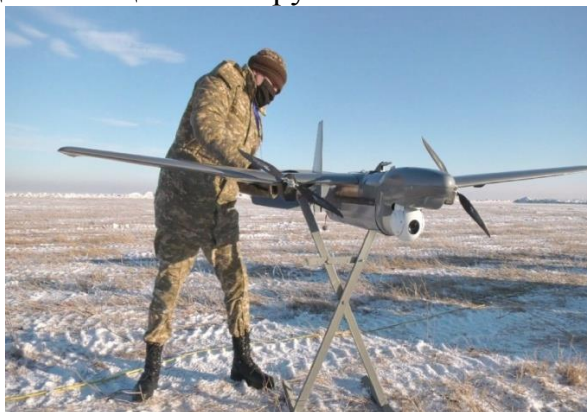
Рисунок 2. Демонстрационные полеты БПЛА «Шагала»

Разумеется, исследования БПЛА продолжается, но уже сейчас можно оценить их важность для оснащения Вооруженных Сил.