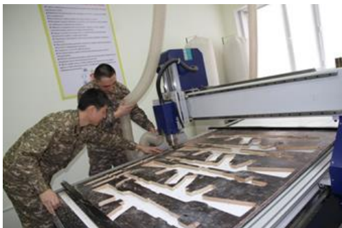
Рисунок 1. Фрезерование с числовым-программным управлением.

- освоение и использование технологий трехмерного сканирования и оцифровки объектов (деталей, узлов, агрегатов) для дальнейшей доработки и модернизации.