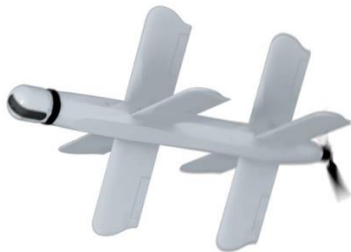
Рисунок 2 - Барражирующий боеприпас «Ланцет-3».

Кроме того, беспилотник оснащен телевизионным каналом связи, который передает изображение цели, что позволяет подтвердить успешность поражения [4].