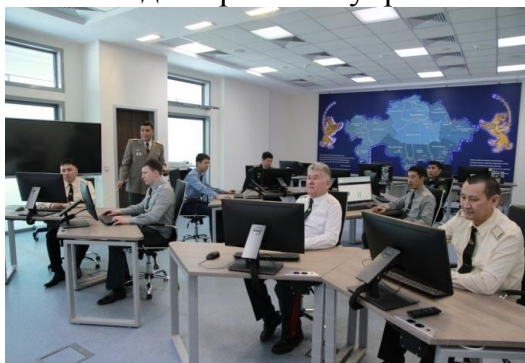
Рисунок 3. Центр информационно-аналитического обеспечения «ИРБИС»

Центр создает условия для наиболее эффективного использования информационных ресурсов органами управления и должностными лицами Вооруженных Сил, других войск и воинских формирований Республики Казахстан в области материально-технического обеспечения, каталогизации продукции военного назначения и предметов снабжения, военных стандартов, а также визуальной аналитики для принятия управленческих решений.