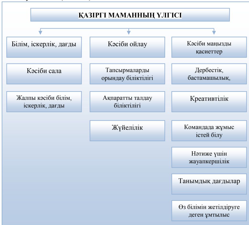
1-кесте – Қазіргі маманның үлгісі

Осыған байланысты болашақ маманның оқу орнында алған білімдері мен іскерлік дағдылары бүгінгі заманауи маманның үлгісіне сәйкес қалыптасуы қажет (1-кесте)