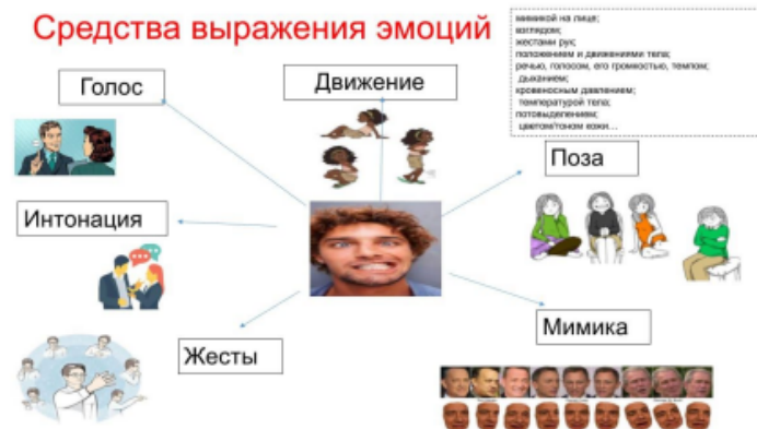
Рисунок 2. Средства выражения эмоций (Садвакасова З.М., 2020)

Высокий уровень эмоционального интеллекта позволяет создать в процессе коммуникации рабочую среду, где процветают плодотворный обмен информацией, доверие, здоровый риск и стремление к самосовершенствованию. Наоборот, низкая степень развития эмоционального интеллекта порождает атмосферу неуверенности и страха или вызывает негативную цепную реакцию у человека.