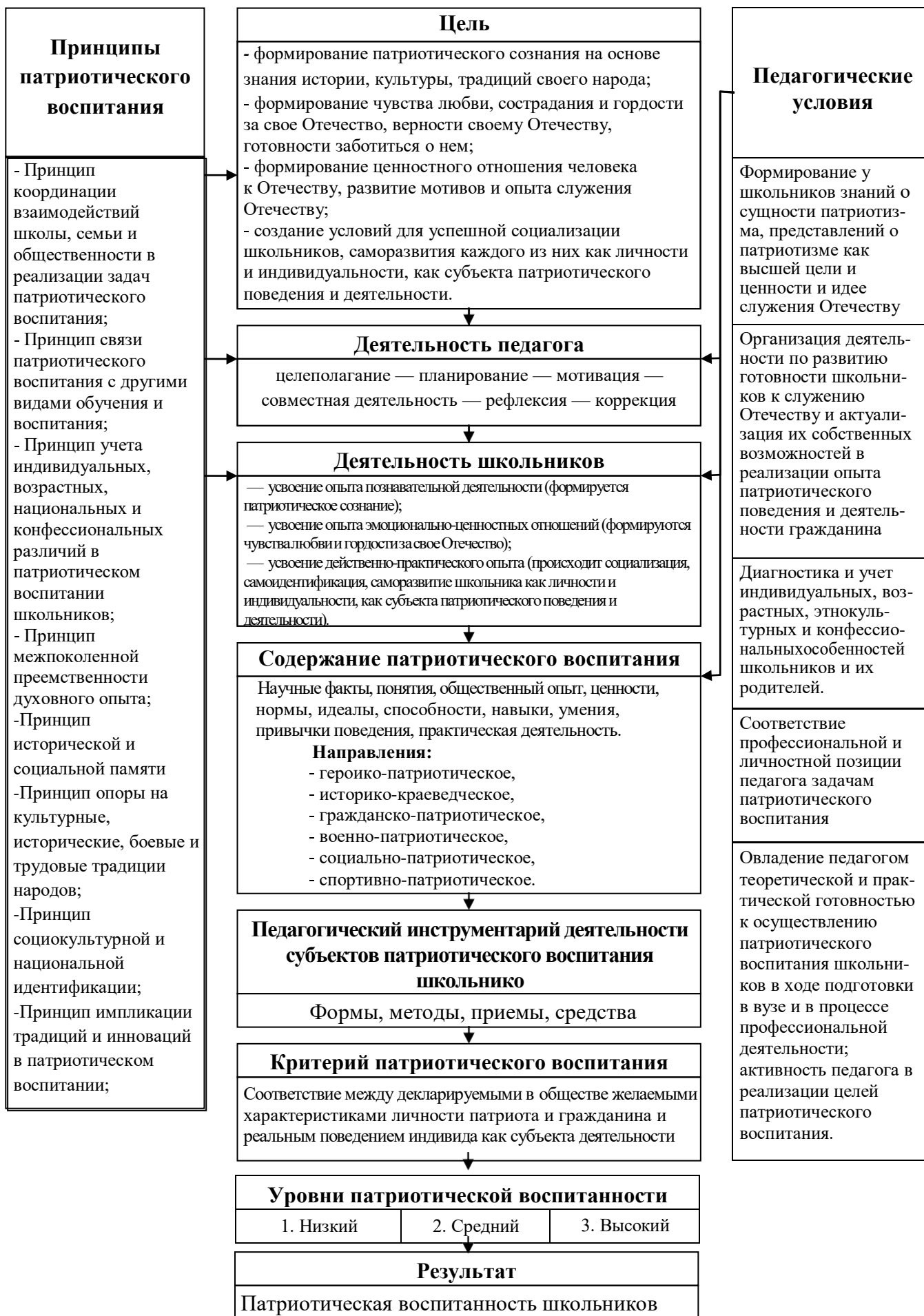
Рисунок 1. Модель процесса патриотического воспитания школьников Компоненты модели: целевой, субъектно-объектный, содержательный, операционально-технологический, критериально-результативный