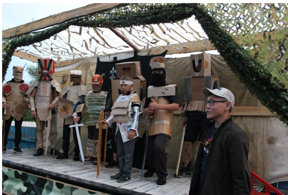
Фото 4. Конкурс в палаточном лагере

На сегодня деятельность отряда вышла далеко за рамки района: продолжается более чем 10-летнее партнёрство с отрядом «Штайнадлер» из Висбадена (Германия. Союз немецких скаутов). При содействии отряда «Полюс» начал работу отряд «Хаски» из ГУ «Железнодорожная СШ», а также действует отряд «Батыр» в Амангельдинском районе Костанайской области.