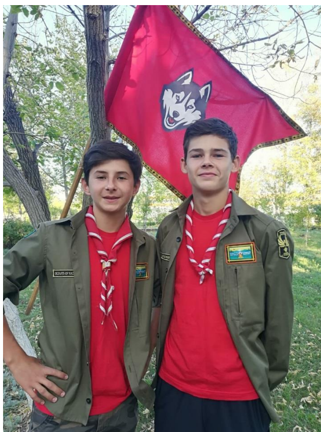
Фото 3. Скауты из отряда «Хаски». ГУ «Железнодорожная средняя школа Карасуского района.

За годы работы отряда в небольшой сельской школе педагоги и родители отмечают особые личностные качества скаутов: ребёнок, пришедший в отряд, постепенно меняется. Исчезают неуверенность, закомплексованность у тихих и замкнутых детей. И напротив – шумный и порой неуправляемый ребёнок становится более сдержанным, не теряя при этом своей энергии, которая направляется в созидательное русло. В программе деятельности отряда есть и служение обществу: помощь пенсионерам, ветеранам войны и труда, социально значимые акции на территории села.