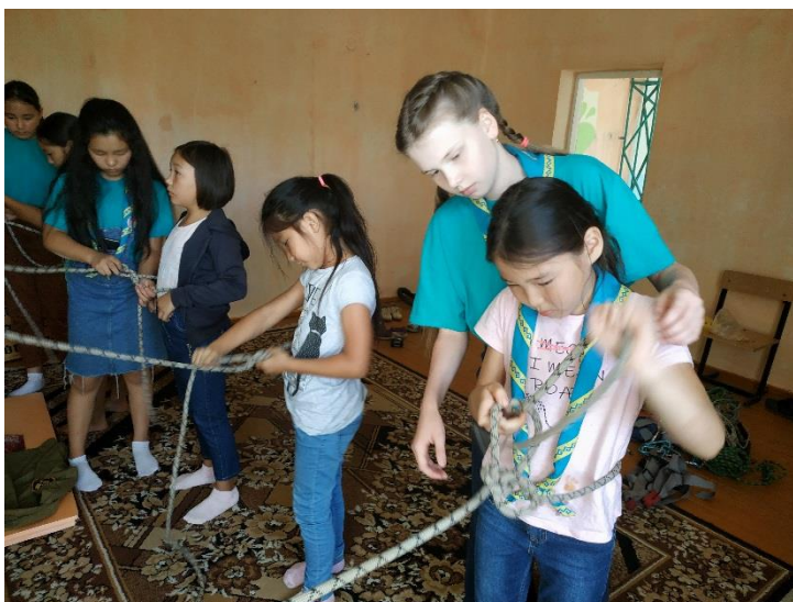
Фото 5. Практика вязания узлов. Занятия с новичками.

Эта же модель отношений переносится в целом на школьную среду. Работа отряда является существенным дополнением к воспитательной работе внутри школы. Хотя следует отметить недопонимание педагогами сущности скаутского Движения. Часто суть работы педагогов сводится к формальным мероприятиям, в то время как скаутинг – постоянная, непрерывная круглогодичная деятельность. Ребёнок, пришедший в отряд, ощущает на себе заботу старших, взаимопомощь и понимание его особенностей. Маленький человек начинает свой скаутский путь, постепенно, в ходе деятельности, участь многому шаг за шагом. Обучение через деятельность – одна из составляющих скаутского метода. Никто не читает ребенку нотаций.