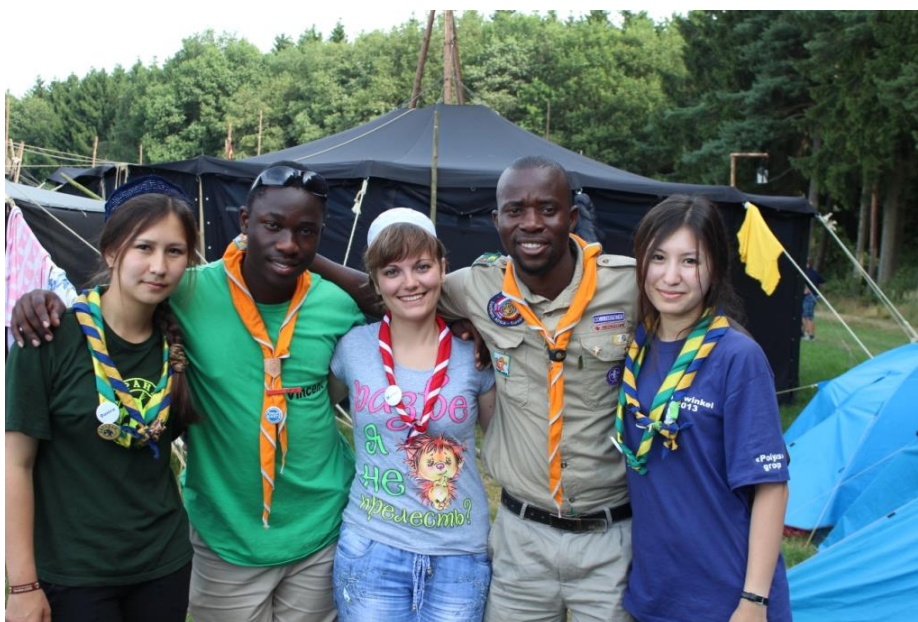
Фото 1. Со скаутами Южной Африки. Германия. 2013 г.

2012- палаточный лагерь скаутов «Морские волки» для детей из социально незащищённых семей Костанайской области. (совместный проект «Лето-для всех» Организации скаутского движения Казахстана и ОФ «Бота»). Место проведения: база отдыха «Радуга» (г.Костанай). Лагерь признан лучшим проектом для молодёжи в конкурсе НПО Костанайской области.