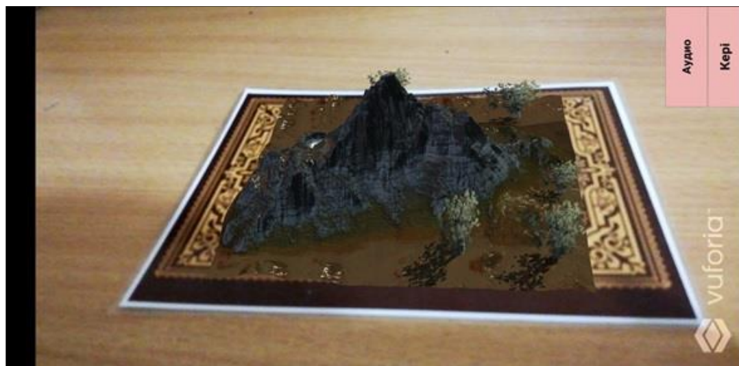
Рисунок 2. Дополненная реальность к переводу Абая Кунанбаева «Горные вершины спят во тьме ночной...»

Также нами были разработаны дополненная реальность к произведениям великого казахского поэта Абая Кунанбаева (Рис. 2). Книга стихов с применением дополненной реальности это увлекательная история с поучительным смыслом. При наведении камеры телефона пейзажи книги воплощаются в жизнь, воспроизведя «живой» рассказ книги.