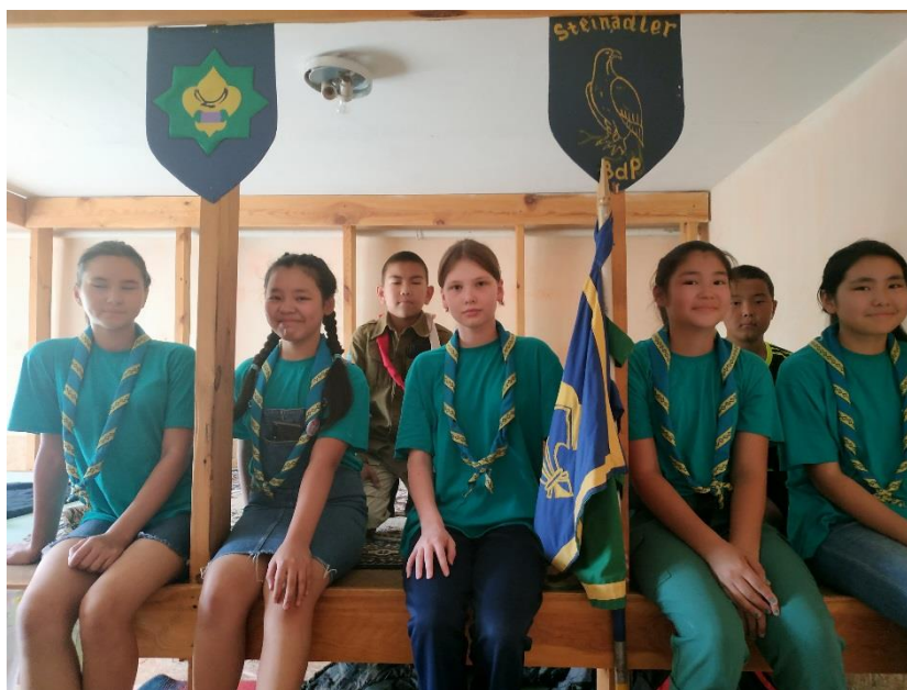
Фото 2. На отрядном сборе.

2019 г. - участие в Международном скаутском тренинге (г.Астана) с участием тренеров Всемирной Организации Скаутского Движения из Португалии, Индии, Чехии, России и Сингапура.