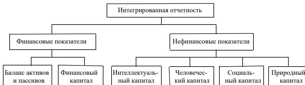
Рисунок 1 – Структура и состав показателей интегрированной отчетности Примечание – составлено на основе источников [17; 18]

Интегрированная отчетность может содержать следующие разделы [6, 16]: