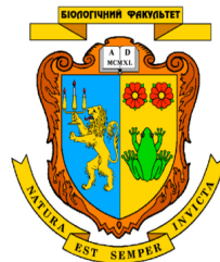
Faculty of Biology of Ivan Franko National University of Lviv