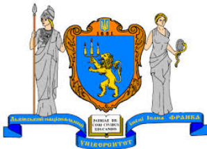
Ivan Franko National University of Lviv