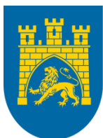
Lviv city council