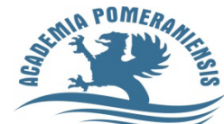
Instytut Biologii i Ochrony Środowiska Pomeranian University in Slupsk, Poland