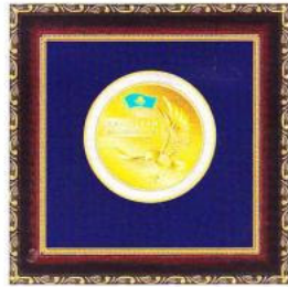
Медаль «ЛИДЕР КАЗАХСТАНА 2013»