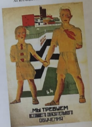
Дейнека А.А. Плакат «Мы требуем всеобщего обязательного обучения»