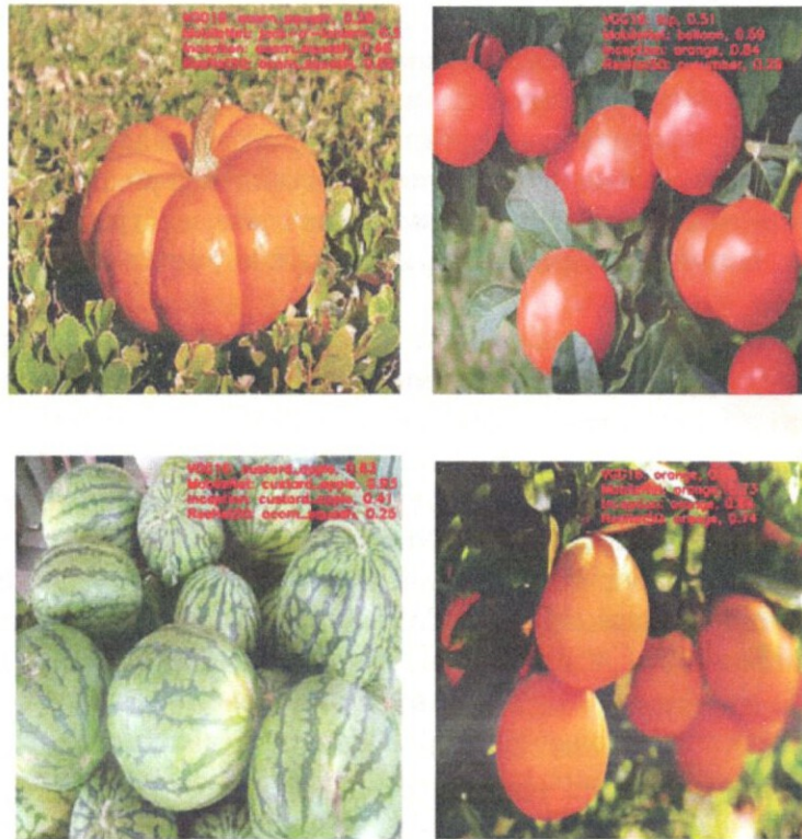
1-рис. – Результаты различных моделей

При сравнении итоговых данных видно то, что не были достигнуты желаемые результаты, так как вышеуказанные модели нейронных сетей смогли распознать только апельсин, остальные агропродукты не были распознаны. Для решения данной проблемы будет использована методика Transfer Learning и применена к нейронной сети модели VGG16.