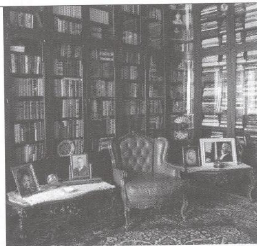
2 сурет. Д.А.Қонаевтың жұмыс бөлмесі кітап сөрелері