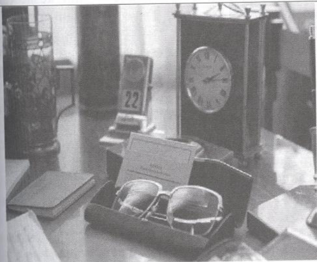
1 сурет. Д.А. Қонаевтың жұмыс үстелі, жеке заттары.

Мұражайдың ерекше құндылығы – мемориалдық пәтер-мұражайының толықтығында және құрамының кеңдігінде. Мұнда сақталған жәдігерлер Дінмұхамед Ахметұлының дүние-мүлікке қызықпайтын қарапайым адам болғанын, оның қарапайым тіршілігін, қалай дем алып нендей дүниеге қызығушылық білдіретінін аңғартады. «Д.А.Қонаевтың мемориалдық пәтер - мұражайы» - бұл өткен тарихымызбен таныстыратын орын әрі өнегелі өмірдің нағыз куәгері.