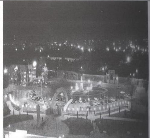
4-сурет «Көне Тараз» қорық-мұражайының қазіргі ксіті