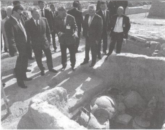
3-сурет. Н.Ә. Назарбаев «Көне Тараз» қорық-мұражайының ашылуында