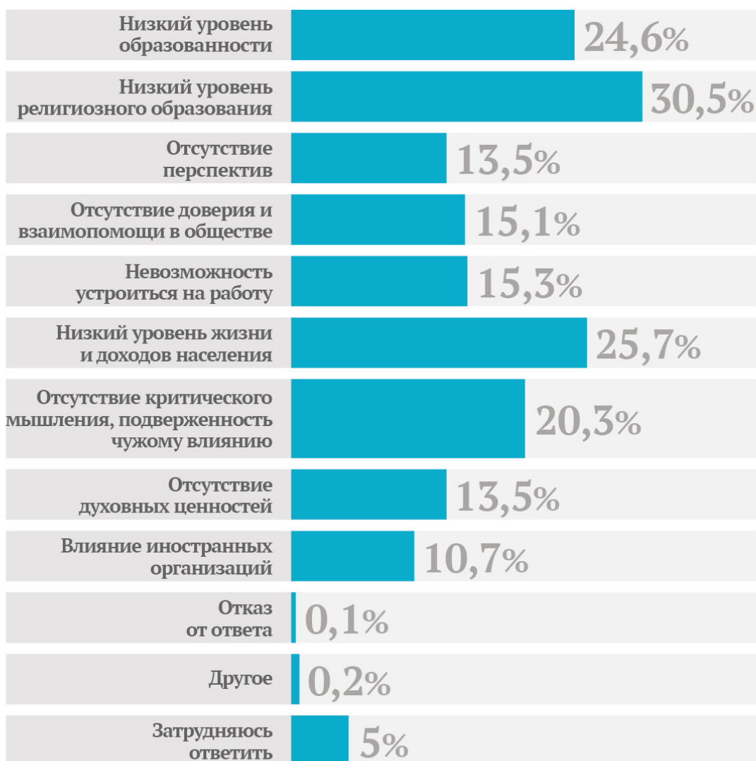
Таблица 2. По Вашему мнению, в чем основные причины распространения идей религиозного экстремизма и терроризма в Казахстане? (до двух вариантов ответа)

Религиозное невежество приводит к радикализации. Яркий пример – судьба бывшего выпускника Университета исламской культуры «Нур-Мубарак», превратившегося из подававшего надежды молодого человека в экстремиста 99 . Другим фактором тенденции исламизации является то, что такие запрещенные движения, как, например, «Хизб- ут-Тахрир», выполняют и культуртрегерские функции. Многие люди примыкают к организации именно для того, чтобы узнать больше об исламе, а не преследуя некие политические цели.