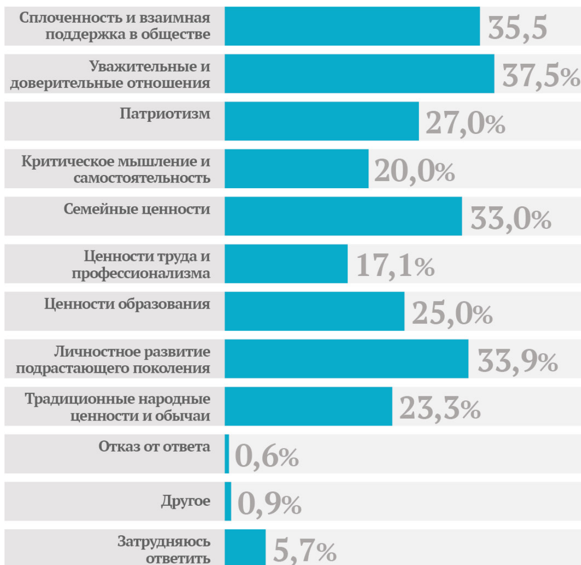
Таблица 3. Укрепление каких ценностей поможет не допустить распространение идей религиозного экстремизма и терроризма в Казахстане? (количество вариантов ответа не ограничено)

Давно известно, что «если школа и семья не в состоянии обеспечить пространство для самореализации личности, на их место приходят элементы тюремной субкультуры или радикальные религиозные группы. Как правило, объем знаний молодежи несколько мал, а желание прикоснуться к «великому» и «запретному» настолько велико, что глобальные идеи радикальных религиозно-экстремистских групп ложатся на благодатную почву, и заслонном здесь может быть своевременное широкое понимание и восприятие собственных культурных и исторических ценностей и их значимости» 104 .