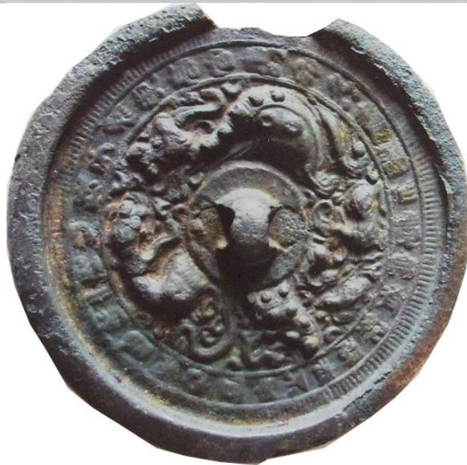
Сурет 1 – Күршім ауданынан табылған қола айна