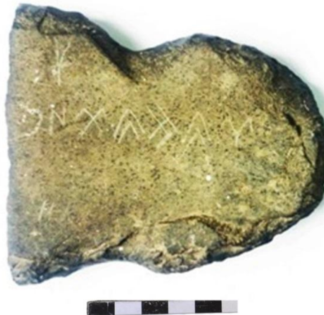
Сурет 3 – Көне түрік бітік жазулы мәтіннің фотосуреті