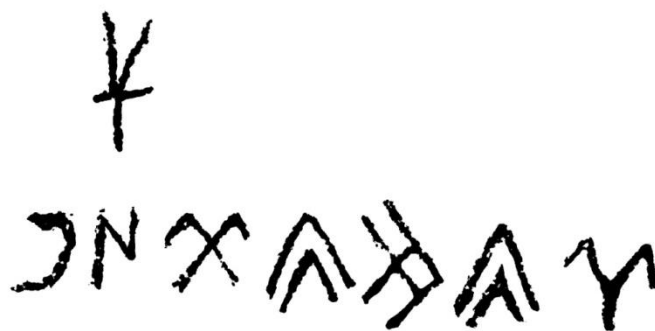
Сурет 4 – Көне түрік бітік жазулы мәтіннің сызбасы (Н. Базылхан, 2015 ж.)