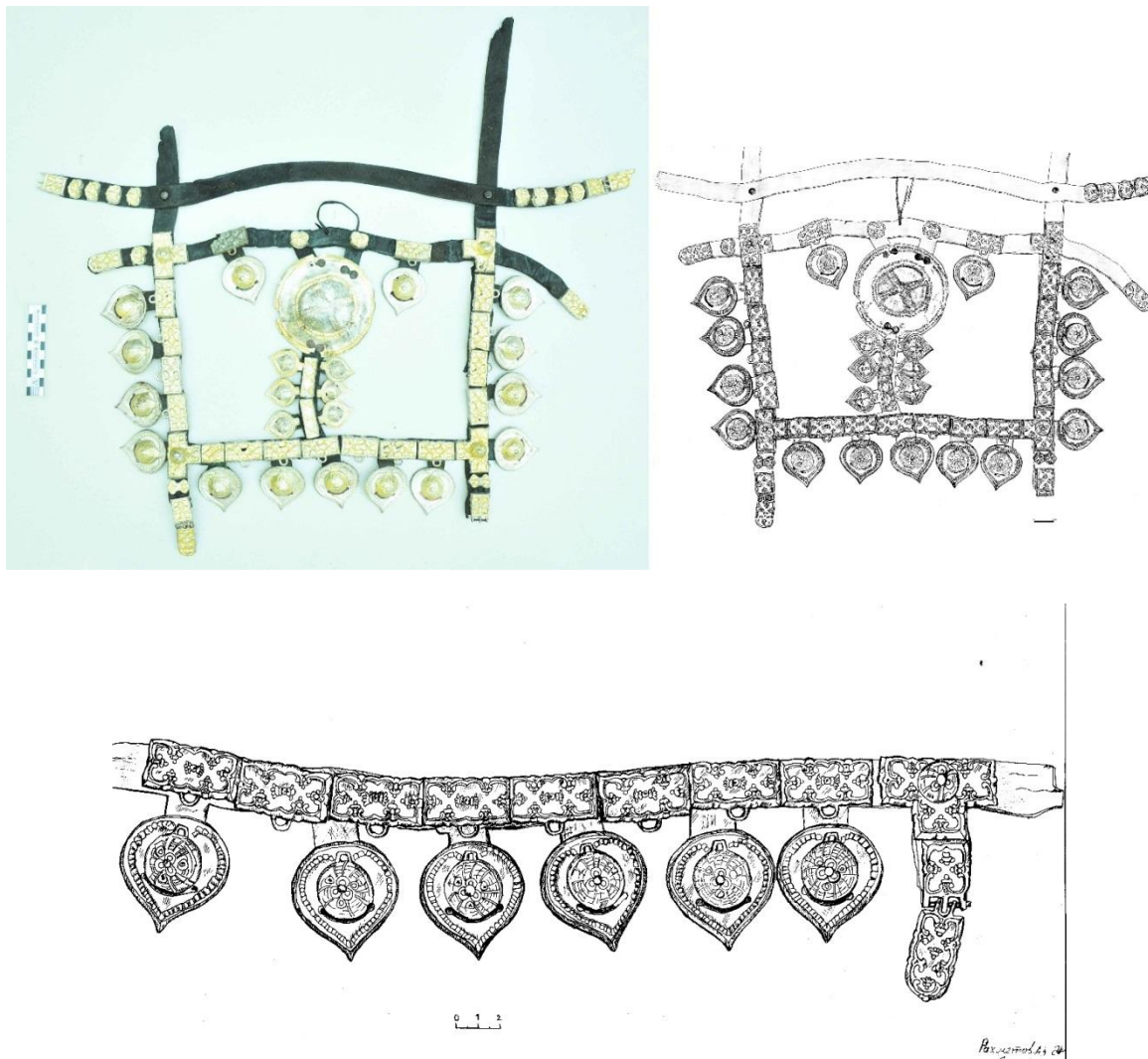
Сурет 5– Түйетастан табылған кимак ат әбзелі