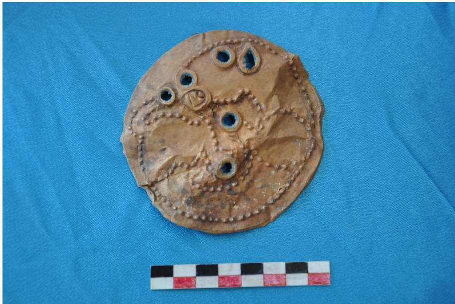
Сурет 2– Мысық тұқымдас аңның бейнесі