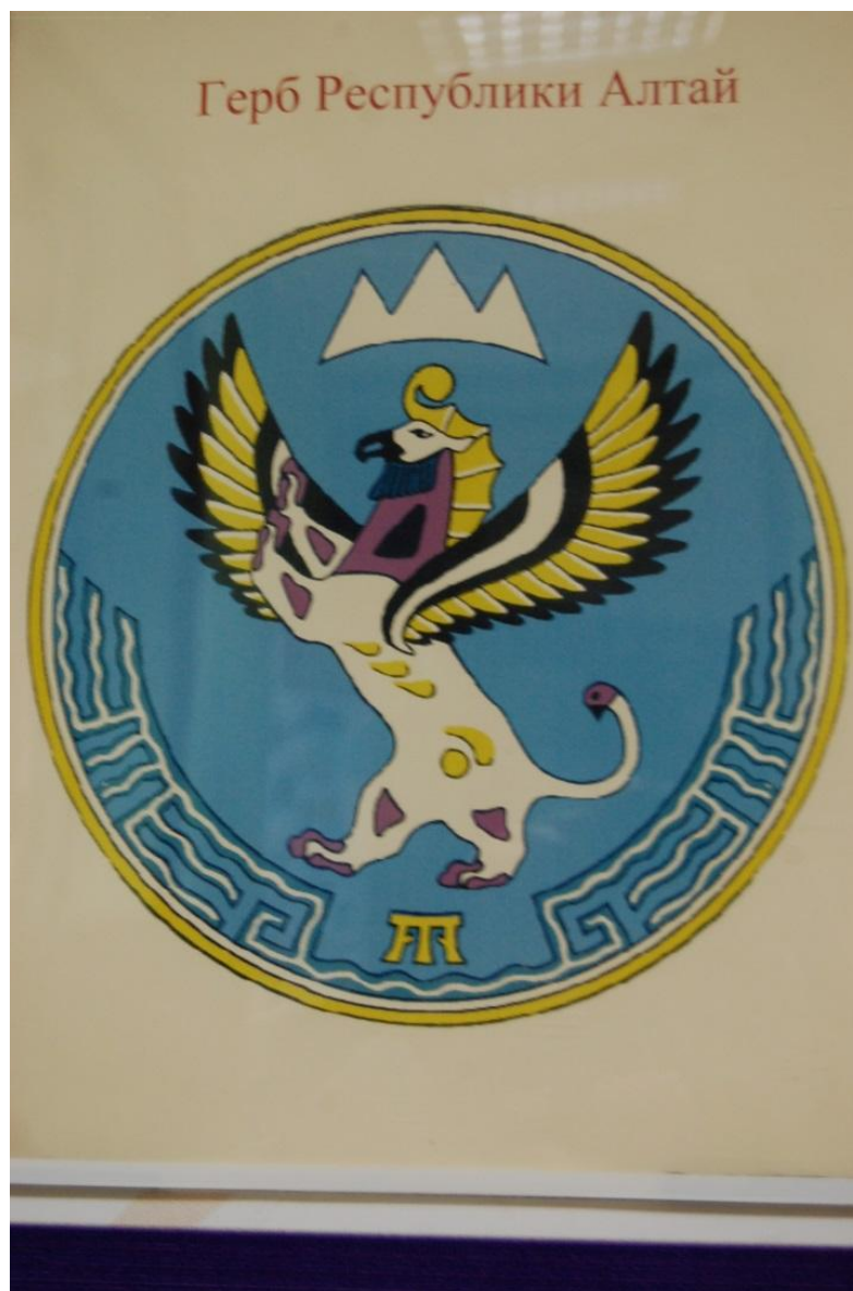
Рис. 4. Герб Республики Алтай РФ.