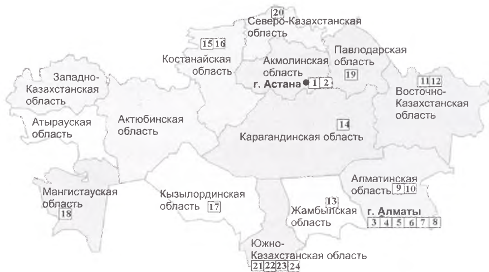
Рисунок 1 – Аквапарки Казахстана. 1 «Sky Beach Club», г. Астана, 2 «Алау», г. Астана, 3 «Восьмое чудо света», г. Алматы, 4 «Family Park», г. Алматы, 5 «Дельфин», г. Алматы, 6 «Hawaii», г. Алматы, 7 «Мереке», г. Алматы, 8 «Алатау», г. Алматы, 9 «Капчагайский аквапарк», г. Капчагай, 10 «Каратал», г. Талдыкорган, 11 «Аквапарк», г. Семей, 12 «PRIMA-ZODIAK», г. Усть-Каменогорск, 13 «Аквапарк», г. Тараз, 14 «Дельфин», г. Караганда, 15 «Лагуна», г. Костанай, 16 «Осьминог», г. Костанай, 17 «Арай», г. Кызылорда, 18 Развлекательный комплекс «Treeoflife», г. Актау, 19 «Балатау», г. Баянаул, 20 «Нептун», г. Петропавловск, 21 «Letopark», г. Шымкент, 22 «Дельфин», г. Шымкент, 23 «Джумейра», г. Шымкент, 24 «Сауран», г. Шымкент

К настоящему времени в Казахстане насчитывается 24 аквапарка (рис. 1). Основная часть их расположена в городах Алматы, Астана, Шымкент. Это обуславливается большим спросом в этих городах. Аквапарки Казахстана открылись относительно недавно. Первым построенным на территории Казахстана аквапарк был в г. Капчагай. Аквапарк в г. Капчагай построен совместно с итальянскими предпринимателями в августе 1993 г. с целью оказания услуг отдыха и спортивно-оздоровительных услуг на воде.