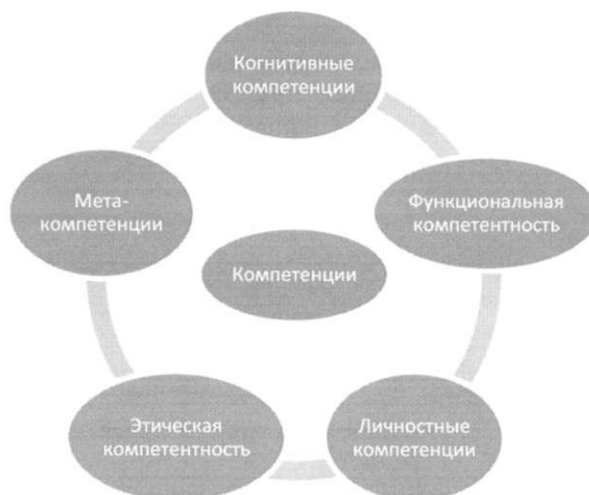
Рисунок 2. Модель профессиональной компетенции Cheetham and Chivers (1996, 1998)

– Мета-компетенции, относятся к способности справляться с неуверенностью, также как и с поучениями и критикой.