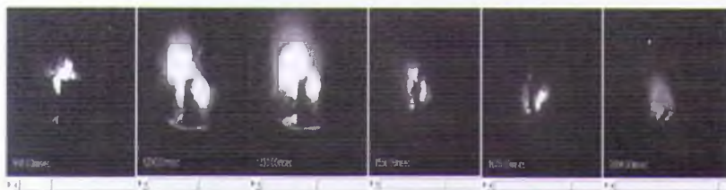
(AN/MgAl, 3 МПа, время горения – 824 мсек, h = 8,58 мм)

На рисунке 1 приведен процесс горения ракетных топлив AN-70%/MgAl-30% в камере горения под давлением 3 МПа и 5 МПа